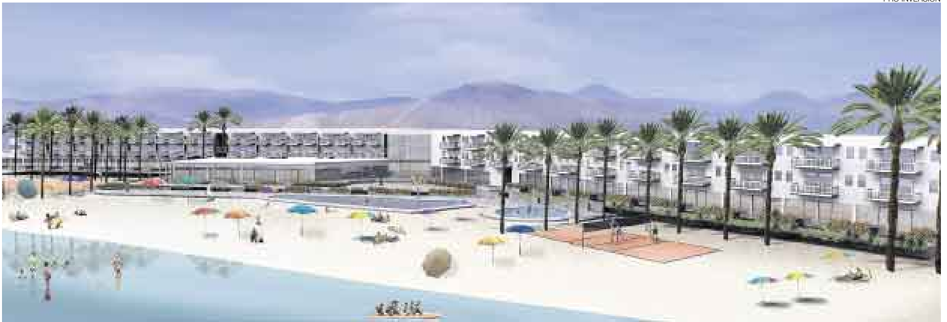
ECOLÓGICO. El proyecto de hotel y albergue San Agustín se anuncia como el primero que opere con energía solar en la zona de Paracas.