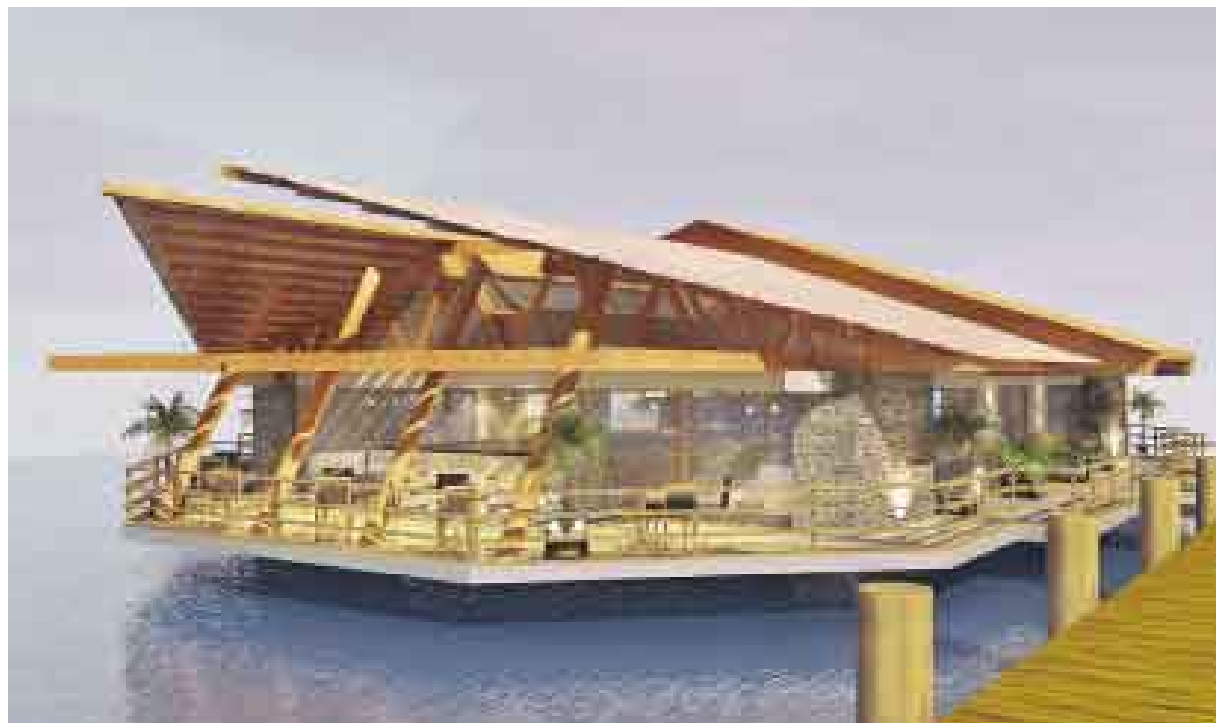
ORIGINAL. La discoteca del Aranwa Resort-Spa flotará sobre el mar, lo que le da un atractivo adicional a este hotel.

Este hotel pondrá a disposición de los visitantes